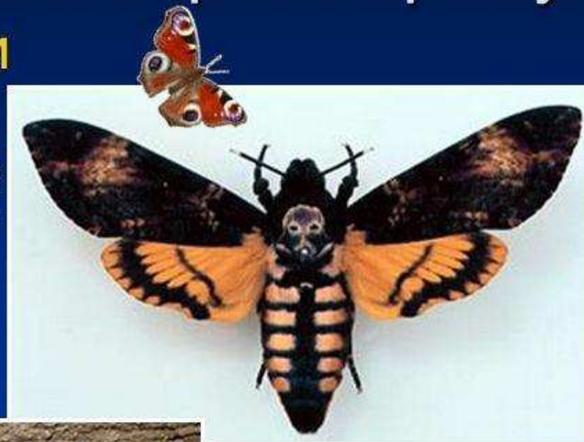
Бражник мертва голова